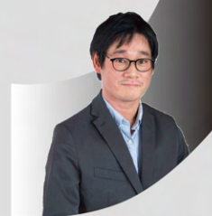
2017年入社 開発・マネージャー 理学系研究科地球惑星科学専攻

入社して一年くらいの頃、新規プロジェクトの担当に名乗りを上げたところ責任者を任せてもらうことになりました。普通の会社だったら、入社後わずかしか経っていないうえに入社前までソフトウェア開発はおろかプログラミングの経験もなかったような新人にこんなチャレンジはさせてもらえなかったでしょう。エリジオンは開発者の知識欲、技術欲に寛容で、手を挙げれば活躍の機会を与えてもらえる、まさに理想郷といえる会社です。私の大学院での研究はソフトウェアと全く関係のない分野でしたが、新しいことを求め直感を信じてこの世界に足を踏み入れたあの時の自分の選択は間違っていないかと確信しています。優秀な仲間から刺激を受け「やってみたい」という情熱が途切れない今の日常は、非常に充実しています。