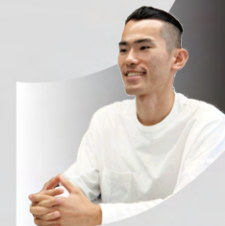
2019年入社 開発・エンジニア 理学部物理学科専攻

大学時代のある出会いに影響を受け、プログラミングを自分の職業にしたいと強く思っていました。この業界について幅広く知るために、アプリ開発のインターンへの参加、WEBサイトの自作、ITコンサルでのデータ分析など様々な業務を体験してきました。その中でエリジオンに出会い、数学的なアイデアをコードで表現するというスタイルがじっくりきて入社を決めました。入社後数年の間にもエリジオンは驚くほど進化を続けていると感じます。自分の小さなアイデアが徐々に広がって、ダイナミズムになることを実感できる。それが一番面白いところで、少数精鋭組織で働く特権だと思います。最後に、エリジオンは数学色・理系色が強い会社ですが、自分とは毛色が違うかと思っただけこそ飛び込んでみてほしいです。進化するエリジオンで、次の変化を生み出すのはあなただからです。