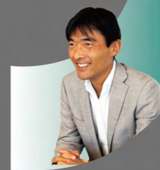
2002年入社 執行役員 / グローバルビジネス・ゼネラルマネージャー 新領域創成科学研究科先端エネルギー工学専攻

もともと大企業に入って定年までレールに乗って過ごしていくのは果たして幸せなのかと漠然と疑問に感じていました。とにかくいろいろな経験ができ、社会人としての自分の実力や価値を高められる会社を探る中で出会ったのがエリジオン。最終的にはコンサルやシンクタンクと迷いましたが、「自分達で作った製品を自分達の手で世界中に売っていく」という点に魅力を感じ入社しました。現在はグローバルビジネスの責任者として、ワールドワイドに世界を飛び回り、マーケットの新規開拓や協業ビジネスの立上げなどに携わっています。ソフトウェアメーカーのほとんどは海外企業です。海外でつくられた製品が日本に入ってくるというのがこの業界の主流ですが、エリジオンはその逆をやっている。まさに「日本発世界」の仕事をしていることに喜びを感じています。