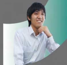
2010年入社 開発・サブマネージャー 理学系研究科地球惑星科学専攻

就活し始めは、ただ漠然と「数学が業務に関係する会社に就職したい」と考えていました。ソフト開発の他、メーカーの研究所や金融も回りましたが、業務内容に興味を持てる企業が見つからず、博士課程進学も視野に入れながら細々と就職活動を続けている状態でした。そんな時、入社試験で面白い数学の問題を出題する会社があると知り、初めは興味本位で説明会に参加。しかし、説明会での製品紹介や社内見学等を通じて、研究室に近い雰囲気、社員の方々のレベルの高さなど、すばらしい環境に魅力を感じ「ぜひとも入社したい」と思いが強くなっていきました。非常にハードな環境であるとは思いますが、やりがいのある仕事ができ満足しています。